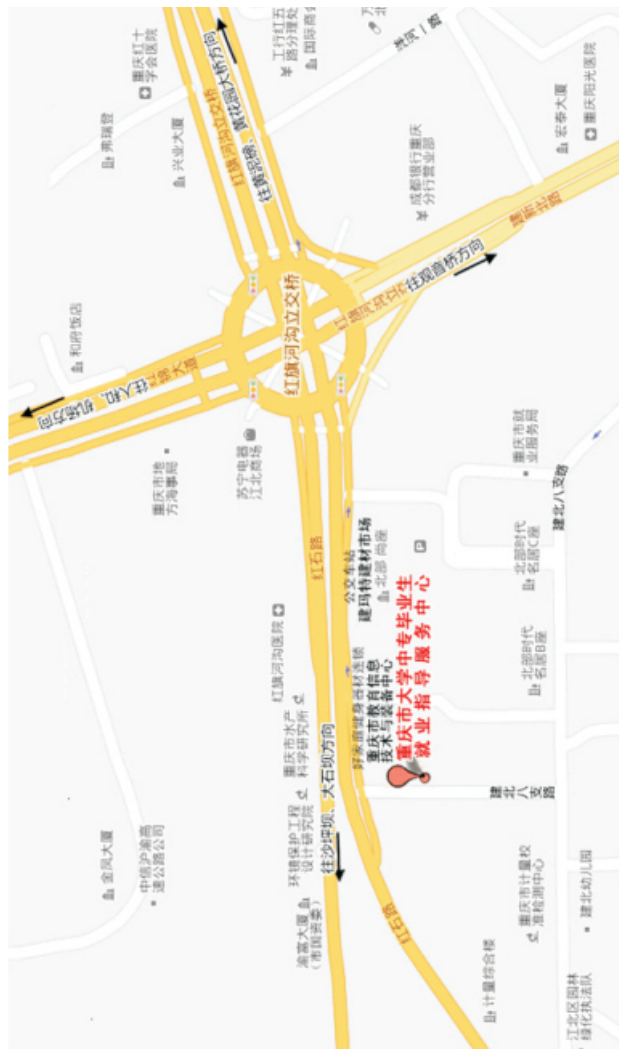
中心位置示意图(如图)